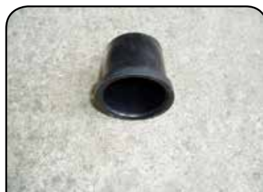
TULIPA PEGADORA DP TC2A