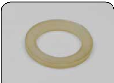
ARRUELA DE GÁS 37mm DP AG 37mm