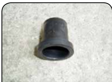
TULIPA PEGADORA DP TC4