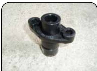
BUCHA DP B4