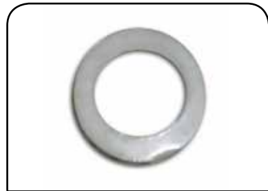
ARRUELA DE GÁS 23mm DP AG 23,88mm