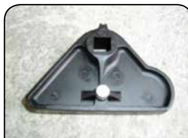
BORBOLETA ESPECIAL DP BESP2