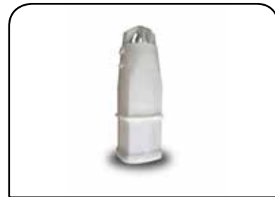
LAVADOR DE RECIPIENTE DP 19 ESPECIAL