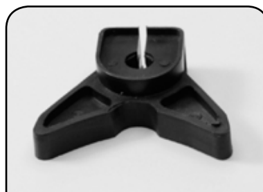
BORBOLETA COM ARRUELA FERRADURA DP B1ELFF