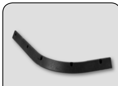
ADAPTADOR DE CARGA DP AC1F