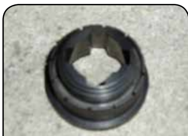
BUCHA DE FIXAÇÃO DP HT5