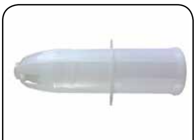
LAVADOR DE RECIPIENTE DP 14