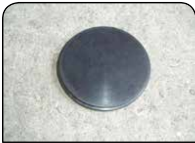
ASSENTO PARA GARRAFA DP ASSENTO