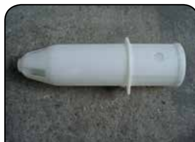
LAVADOR DE RECIPIENTE DP 10 MODIFICADO