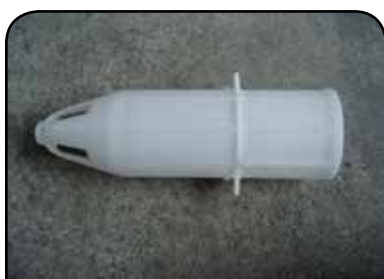
LAVADOR DE RECIPIENTE DP 9 MODIFICADO