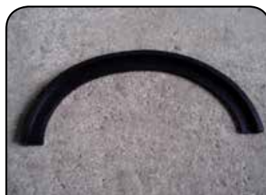
PERFIL DE CAME DP 264