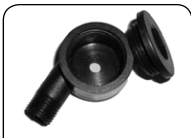
ESGUICHO COM ROSCA E PORCA DP C1RP