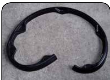
PERFIL DE CAME DP PC1E