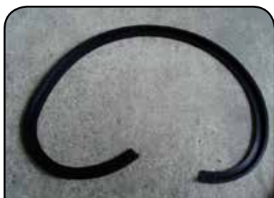
PERFIL DE CAME DP 1067