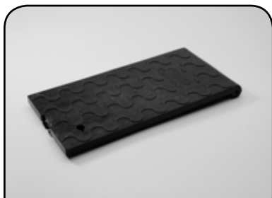
Tampa da caixa de hidrômetro logo Nova Cedae