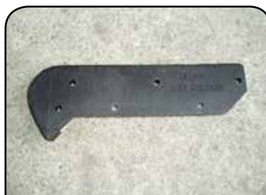
PONTA DE CAME DP 48900677-5