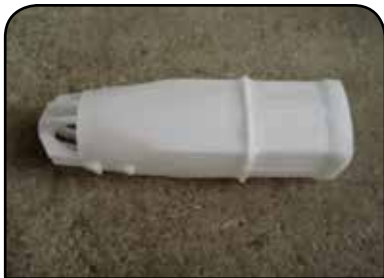
LAVADOR DE RECIPIENTE DP 19 F C/ 4 TRAVAS