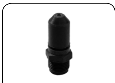
PARAFUSO DO ESGUICHO PARA LAVADORA DP PE1