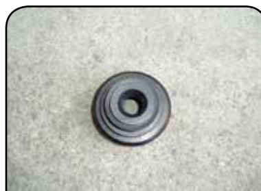
BORRACHA DA TULIPA DUPLA DP DUPLA