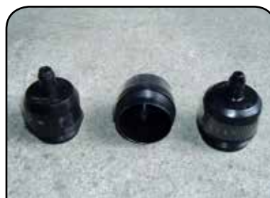
TULIPAS CENTRADORAS DP TC1 / DP TC1A / DP ESP THOQ