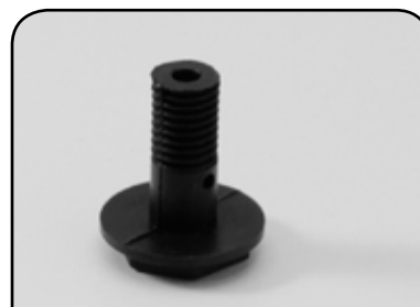
PARAFUSO PLÁSTICO DP TC3A