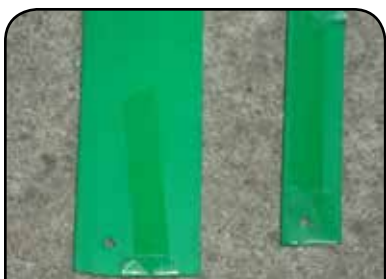
PERFIL DESLIZANTE DP 45-3 / DP-22-3