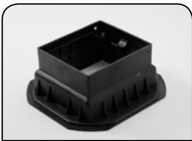
CAIXA DE GÁS