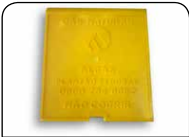
TAMPA DA CAIXA DE GÁS COLORIDA COM APLICAÇÃO DE LOGOTIPOS