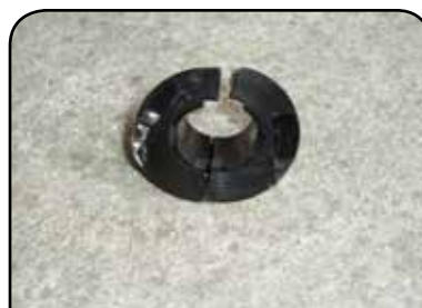
BUCHA BI PARTIDA DE FIXAÇÃO DP HT2