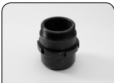
BUCHA DE GUIA DP BG1