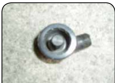
ESGUICHO DP C1