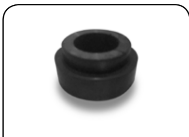
BORRACHA DA TULIPA DP 19mm ALONGADA