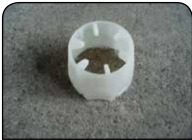
LAVADOR DE RECIPIENTE DP 16A