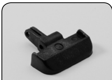
GARRA DESENCAIXOTADORA DP GDM1