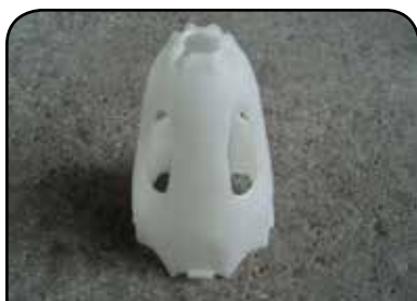
LAVADOR DE RECIPIENTE DP 8