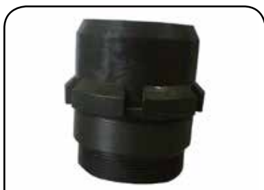
BUCHA DE GUIA DP BG PEQ