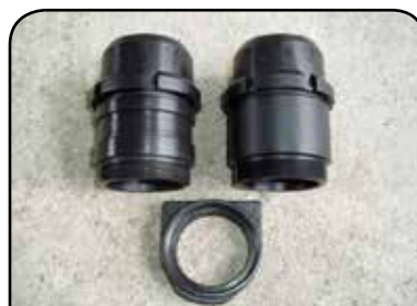
BUCHAS DE GUIA E PORCA DA BUCHA DE GUIA DP BG1 / DP BG1 C/RASGO / DP PG1