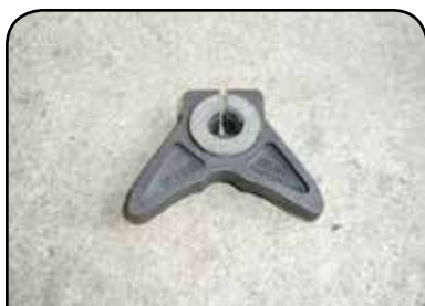
BORBOLETA COM ARRUELA EM LONA DP B2DLF