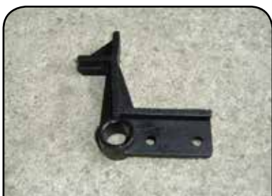
ALAVANCA DP A1