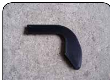
PONTA DOS BATEDORES DE GARRAFA DP PBG1