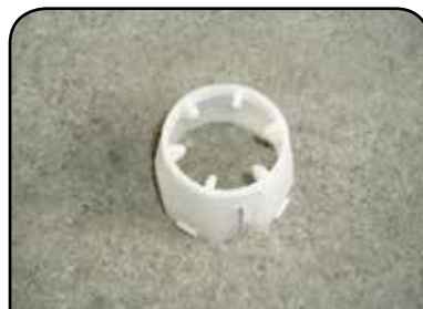
LAVADOR DE RECIPIENTE DP 15K