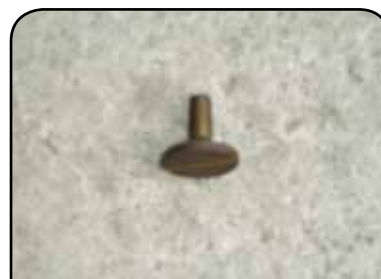
PARAFUSO DA TULIPA EM METAL DP TC5