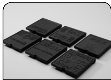
TAMPAS DA CAIXA DE GÁS COM OS LOGOTIPOS : COMGÁS, GBD, DAE, SULGÁS, CEG e COPERGÁS