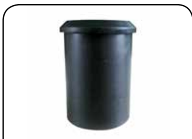
BUCHA LISA DP BL