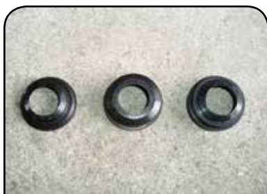
ADAPTADORES DA ENCHEDORA DP AP01 / DP AP02 / DP AP03