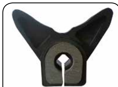
BORBOLETA COM ARRUELA FERRADURA COM FURO QUADRADO DP B1ELFFQD