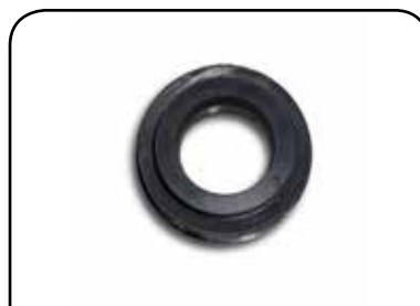
BORRACHA DA TULIPA DP 19mm