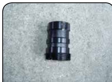
BUCHA DE GUIA DP BG2