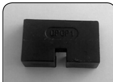
GUIA DO PISTÃO DO ELEVADOR DP GP1