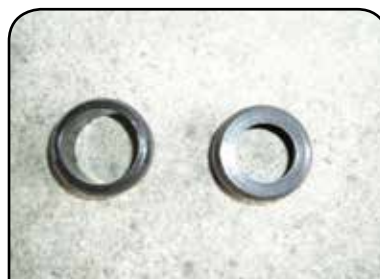
ANEL FIXADOR SUPERIOR ANEL FIXADOR INFERIOR DP AFS / DP AFI