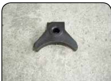
BORBOLETA ESPECIAL DP BESP