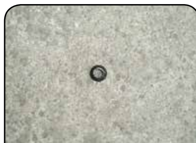
ABA CÔNICA DP ABA CÔNICA