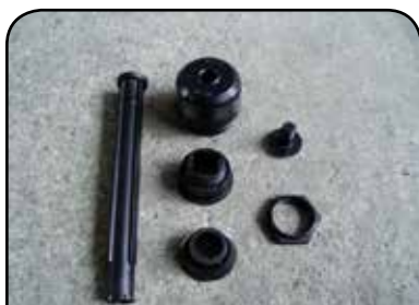
CONJUNTO DA TULIPA DP HT1 / DP TC1A DP HT2 / DP HT4 DP HT5 / DP TC3A