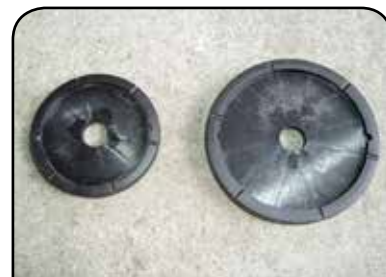
PRATO DA ROTULADORA DP RR1P / DP RR1G