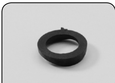
ARRUELA DO PARAFUSO DP PE2