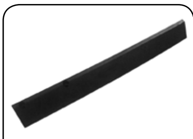
GUIA DE DESCARGA DP GDRF