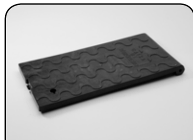
Tampa da caixa de hidrômetro - logo Caixa de Hidrômetro