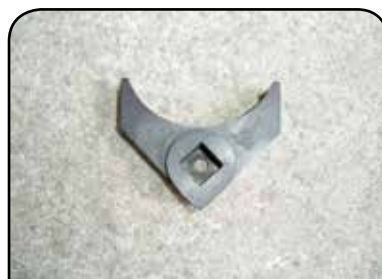
GARRA PARA 600 ML DP GARRA 600ML