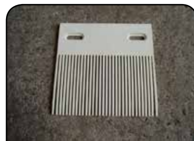
PENTE EM CELCON DP PENTE