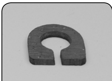
ARRUELA FREIO DA BORBOLETA EM LONA FERRADURA DP ALFBLFF