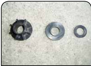
PRATO DE MOLA DP PM1 / PM2 / PM3