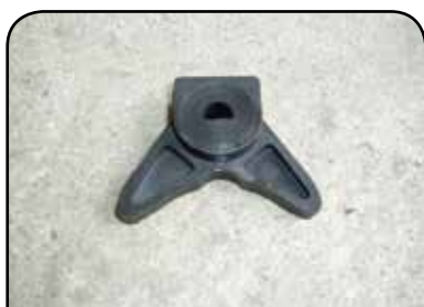
BORBOLETA DP B2DLF CHEIA