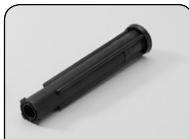
HASTE DA TULIPA PEQUENA DP HT1P