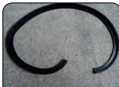
PERFIL DE CAME DP 1066