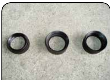
PORCAS DA TULIPA DP TC7 / DP TC4A THOQ