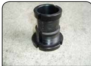
BUCHA DE GUIA DP BG4