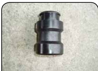
BUCHA DE GUIA DP BG3