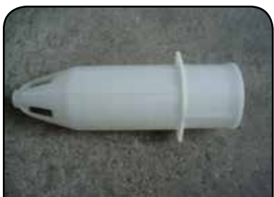
LAVADOR DE RECIPIENTE DP 11