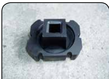
TAMPA DO CILINDRO DP TCILINDRO