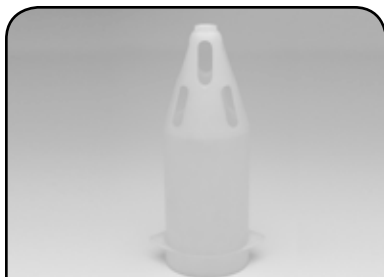
LAVADOR DE RECIPIENTE DP ESP 04