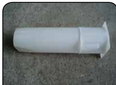
LAVADOR DE RECIPIENTE DP 12 MODIFICADO