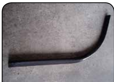
ADAPTADOR DE CARGA DP AC1R