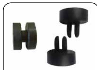
PASTILHA PARA PASTEURIZADORA DP PP1