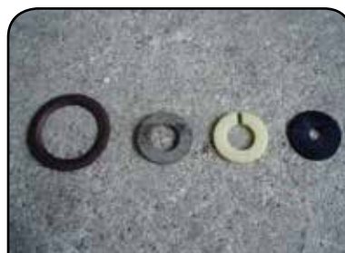
ARRUELA DA TULIPA EM METAL - DP TC6 ARRUELA FREIO DA BORBOLETA EM LONA - DP ALFBLF ARRUELA FREIO DA BORBOLETA EM NYLON - DP ALFBN ARRUELA PLÁSTICA DA TULIPA - DP TC3