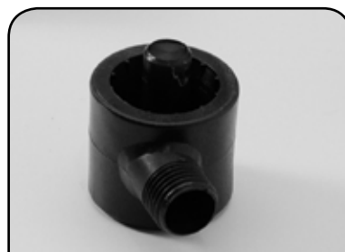
ESGUICHO C/ FURO LATERAL DE 3mm DP C1 3mm