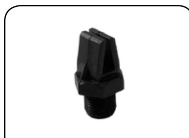
PARAFUSO DO ESGUICHO PARA LAVADORA DP PE2