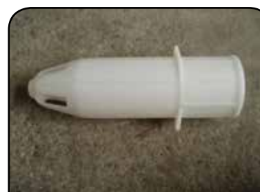
LAVADOR DE RECIPIENTE DP 10ESP