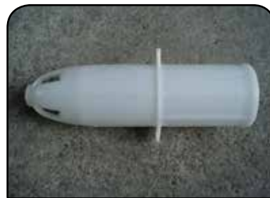
LAVADOR DE RECIPIENTE DP ESP 01