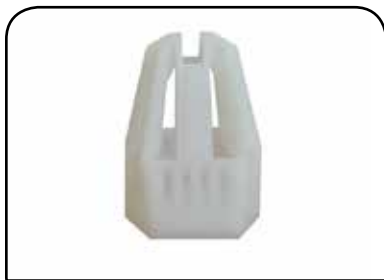
LAVADOR DE RECIPIENTE DP 21