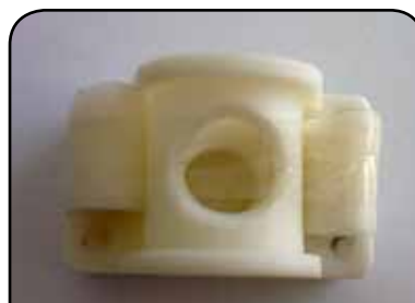
ESGUICHO COM BASE DP C2 C/ BASE