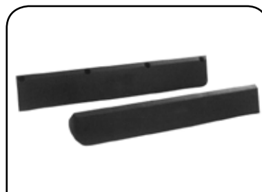
GUIA DE DESCARGA DP GD1F / DP GD1R