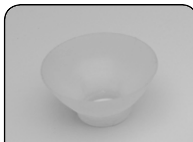
BIQUEIRA PARA LAVADORA DP BO1