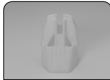
LAVADOR DE RECIPIENTE DP 17