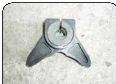
BORBOLETA COM ARRUELA EM LONA DP B1ELF