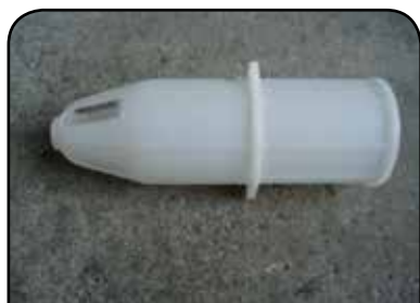
LAVADOR DE RECIPIENTE DP 10ESP 01