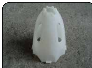
LAVADOR DE RECIPIENTE DP 8G