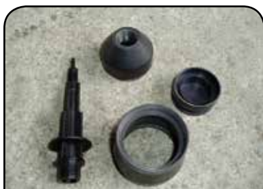
CONJUNTO DA TULIPA DP HD1 COMPLETA DP HD1 / DP TC9AE DP TC1E / DP TC10TP