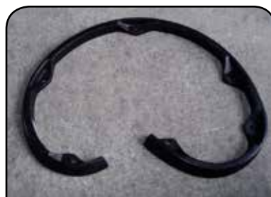
PERFIL DE CAME DP PC1D