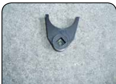
GARRA PARA 300 ML DP GARRA 300ML