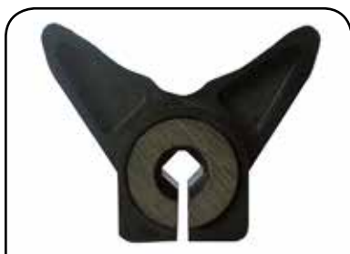
BORBOLETA COM ARRUELA REDONDA COM FURO QUADRADO DP B1ELFQD