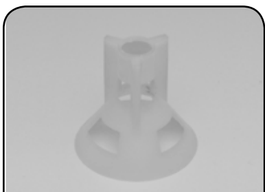
BIQUEIRA PARA LAVADORA DP BO2