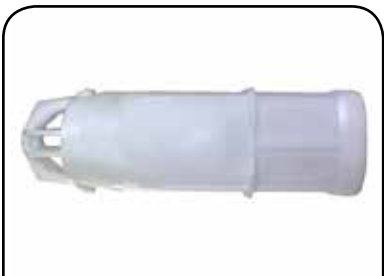
LAVADOR DE RECIPIENTE DP 19 F S/T SEC