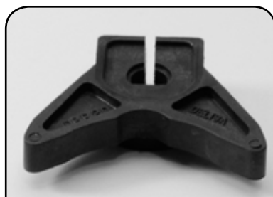
BORBOLETA COM ARRUELA FERRADURA DP B2DLFF