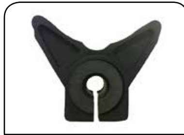
BORBOLETA COM FURO REDONDO / ESTRIADO DP B1EFLF