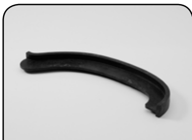
PERFIL DE CAME ESPECIAL DP PC ESP