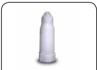
LAVADOR DE RECIPIENTE DP 2