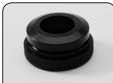
ADAPTADOR DA ENCHEDORA USINADO DP AP03U