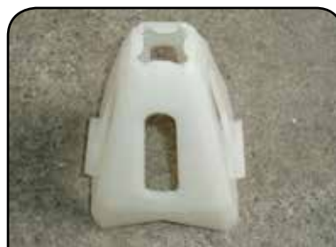
LAVADOR DE RECIPIENTE DP 4