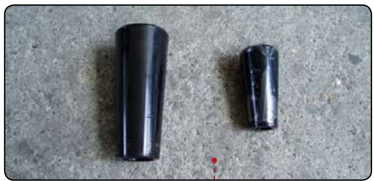
PUNHO DA CHOPEIRA DP 315/29 e DP-314/96