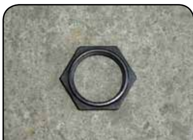
PORCA DA BUCHA DP HT4