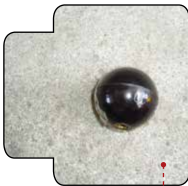
CABO DE METAL DP-315/28