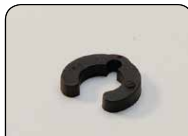
GRAMPO DP TC2