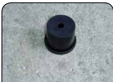
TULIPA PEGADORA DP 1000