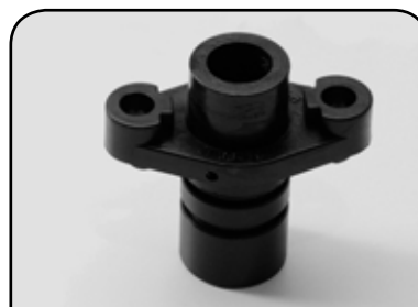
BUCHA DP B4ZG