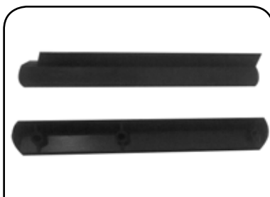
GUIA DE DESCARGA DP GDLAC